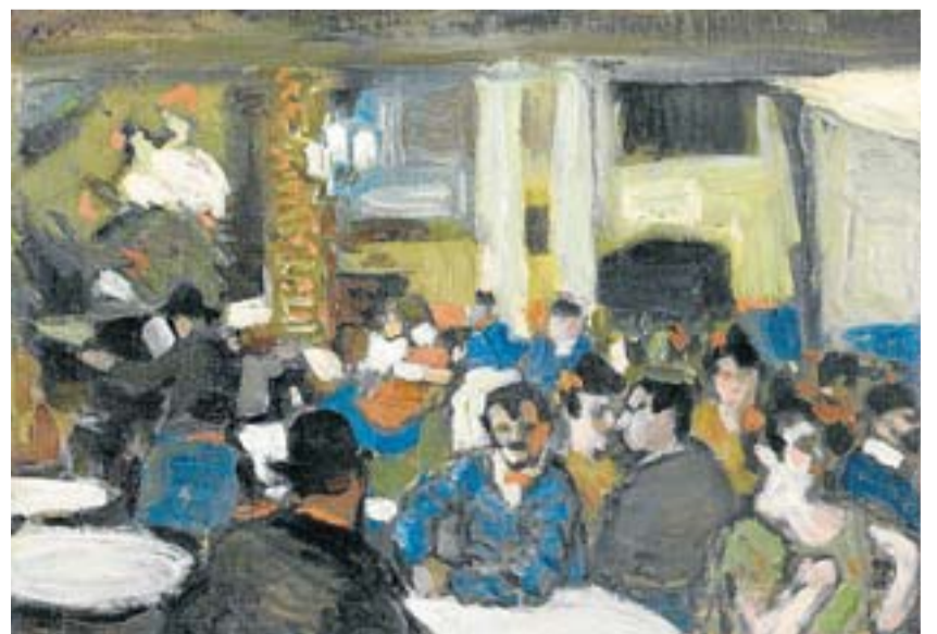
Cafè concert al Paral·lel remet a la vida bohèmia barcelonina. El va comprar el Museu Picasso de París en una subhasta.